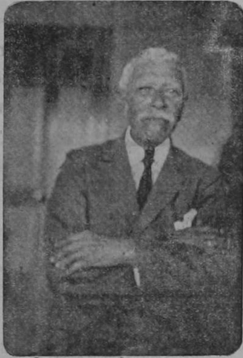
Don Atanasio Coto

Conocido en nuestra literatura nacional bajo el nombre de Fray Juan, con el cual solía firmar sus escritos. Era diácono y contaba 25 años en 1884, cuando dió a la luz una hoja volante protestando de las expulsiones del 18 del citado mes. Su publicación fue recogida por la policía y Fray Juan conducido con grillos al presidio de San Lucas. Murió en 1914.